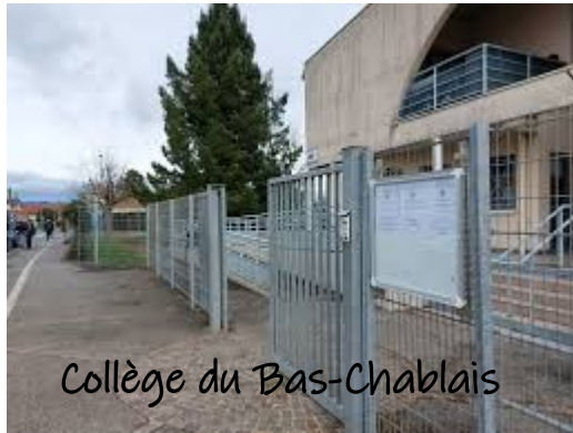
Collège du Bas-Chablais